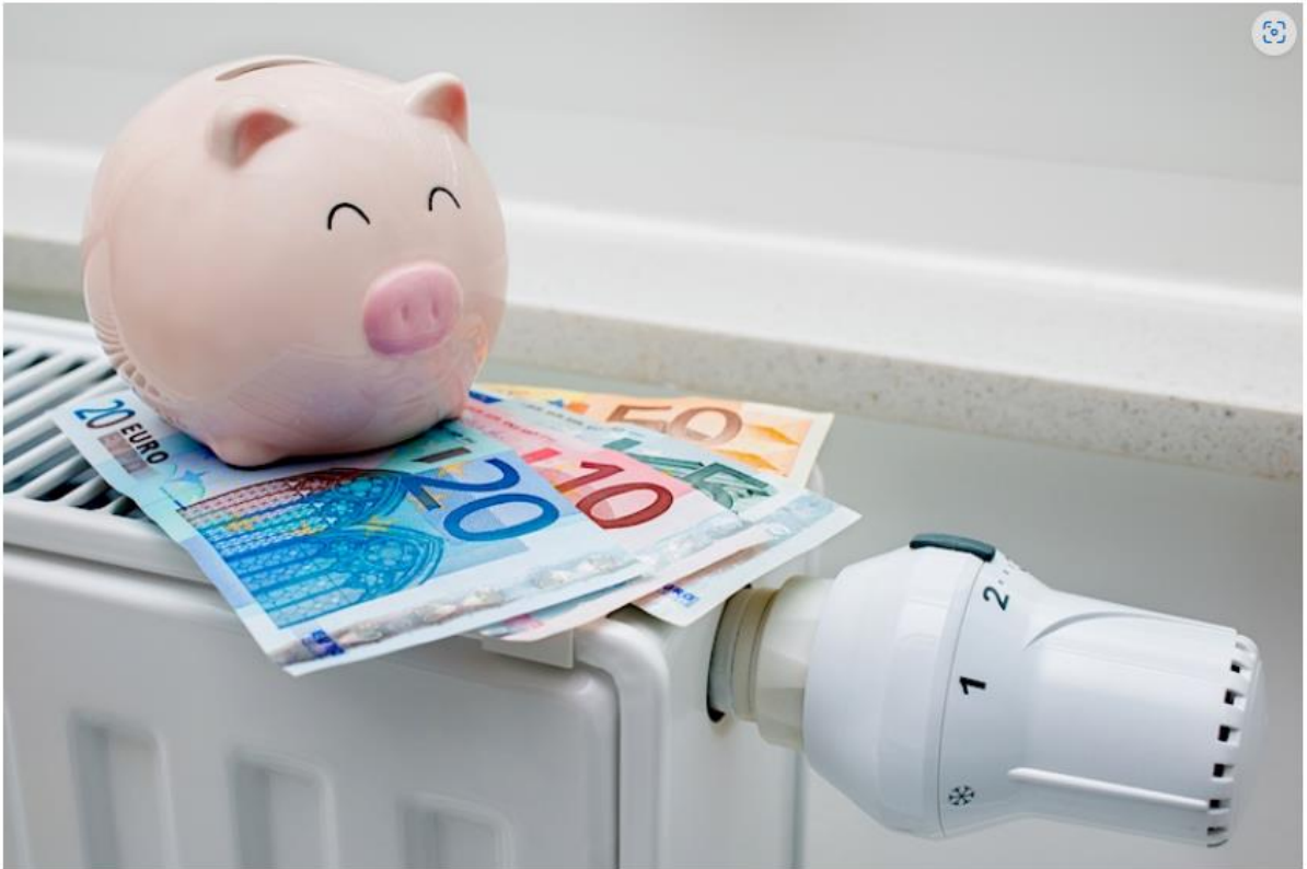
Bild: Wer hätte das vor einem Jahr gedacht? Energiesparen mit der Ölheizung. Aufgrund der zurzeit stark ansteigenden Gas- und Stromkosten ist die Ölheizung auch kostentechnisch eine lukrative Versorgungsalternative.